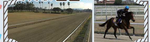
宮崎育成牧場ダートコース 【受付】公園芝生エリア(公園東側)