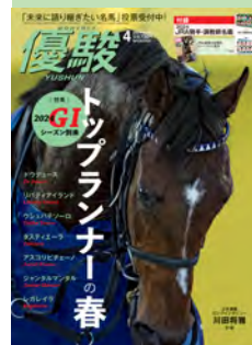
Cover Photo ドウデュース

97 未来に語り継ぎたい名馬物語 05 ファンを心打った“気遣い” シゲルスダチ と人馬の絆