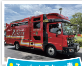
スーパーレスキュー車