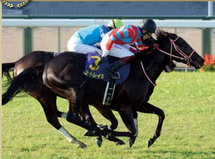
2020年の優勝馬で、最後の直線で早め先頭からアリストテレスの強襲を最後まで凌ぎ切って勝利した。父ディープインパクトと同じ無敗での三冠達成であった。