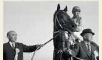
1963年グレートヨルカ