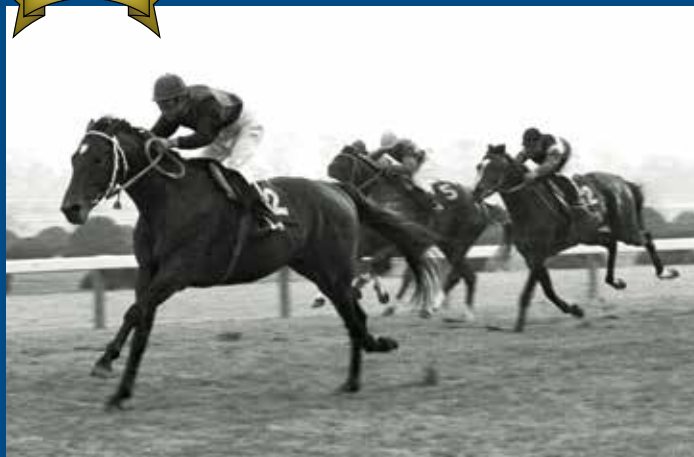
第25回菊花賞 優勝馬 シンザン