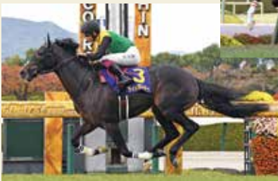
2021年優勝馬:タイトルホルダー