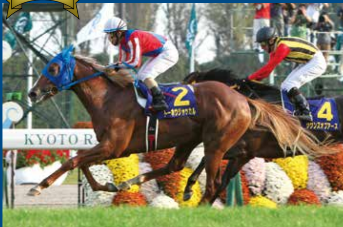
第75回菊花賞 優勝馬 トーホウジャッカル