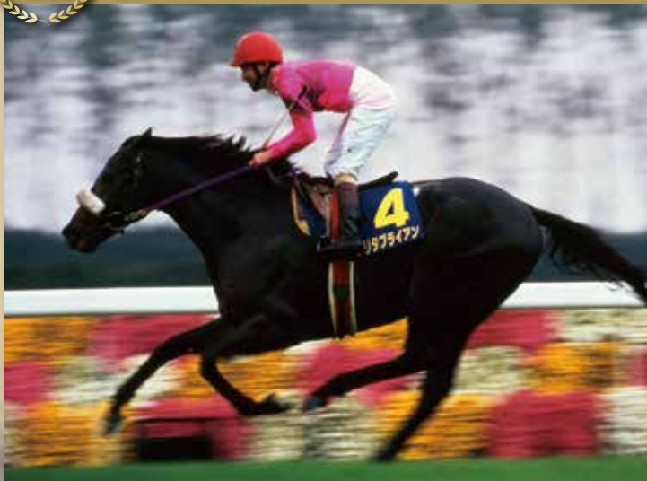
“シャドーロールの怪物”と呼ばれた1994年の優勝馬。本競走では2着馬に7馬身差をつけての圧倒的勝利で、史上5頭目の三冠馬となった。