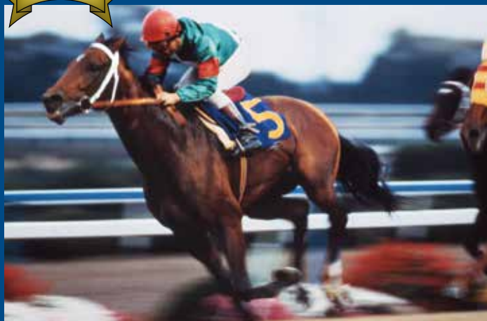
第45回菊花賞 優勝馬 シンボリルドルフ