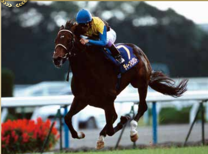
2005年の優勝馬。単勝オッズ1.0倍の圧倒的人気の中、直線で鋭い末脚を見せ勝利。シンボリルドルフ以来2頭目、21年ぶりとなる無敗の三冠を達成した。