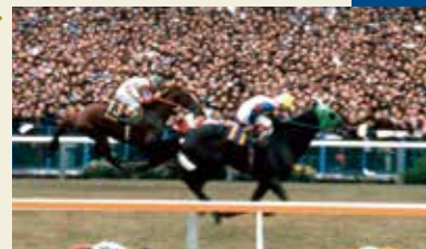
1976年グリーングラス