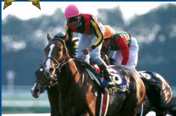
第65回菊花賞 優勝馬 デルタブルース