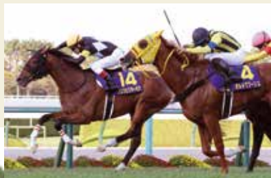
2022年優勝馬:アスクビクターモア

菊花は、菊の花の意。菊は、キク科キク属の多年草で、世界中に1万種以上あると言われている。色や形は種類によって多岐にわたり、観賞用だけでなく食用としても用いられる。花言葉は「高貴」「高尚」。