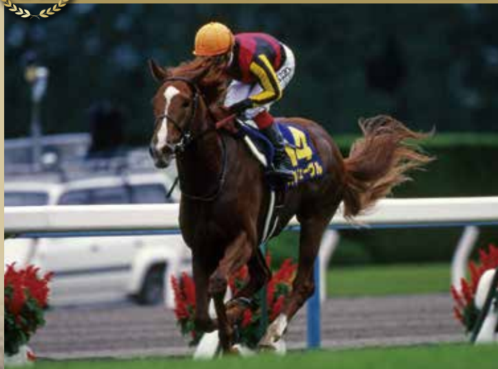
2011年の優勝馬。レースでは最後の3コーナーから徐々に進出を開始すると、直線では独走状態となりそのままゴールした。史上7頭目の三冠馬。