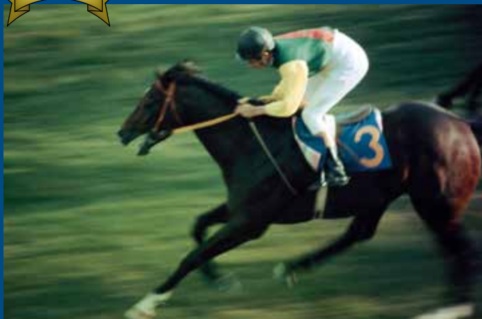
第35回菊花賞 優勝馬 キタノカチドキ