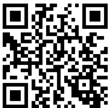
A：大会特設サイト（関係者向け）