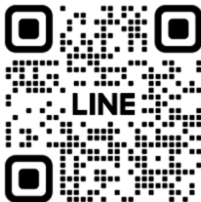
大会オープンチャット (LINE)

※『B：大会特設サイト（一般者向け）』は出場人馬一覧/タイムテーブル/出番表/結果表を掲載する。