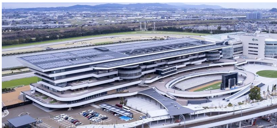
太陽光発電システム（京都競馬場）

太陽光発電システムは、2012年3月に中京競馬場へ設置したのを手始めに、2013年10月より競馬学校（千葉県白井市）と東京競馬場（東京都府中市）で、2014年10月より中山競馬場（千葉県船橋市）で、更に2023年3月に京都競馬場（京都府京都市）で順次運用を開始しています。