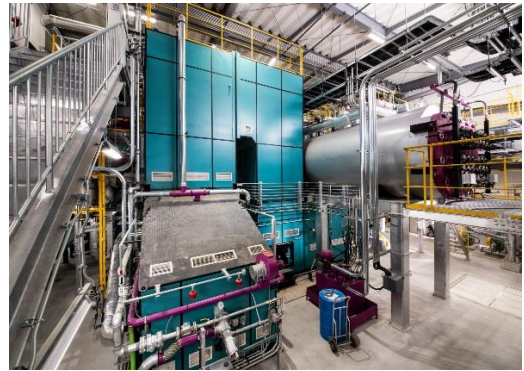
燃焼炉・ボイラ室