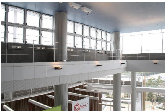
中京競馬場「プラザ eco」

中京競馬場(愛知県豊明市)のペガサススタンド東側のロビー「プラザ eco」にある4階まで吹抜けになっている上部に設けた換気窓は、屋外の気温・天気・風の強さなどを分析し、換気のための自然通風が最適な条件でできるよう自動的に開閉するようになっています。室内の気温が屋外より高いときには、上昇気流が発生するので、1階と3階のスタンド席出入り口上部の外気取入れバランス窓(ランマ窓)が開き、風が吹き込むことで空調設備の使用をコントロールし、使用電力の低減を図っています。