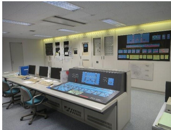
競馬場の中央監視室

競馬場のスタンド内にある「中央監視室」は、競馬開催日に使用するエネルギーの総合コントロールルームです。