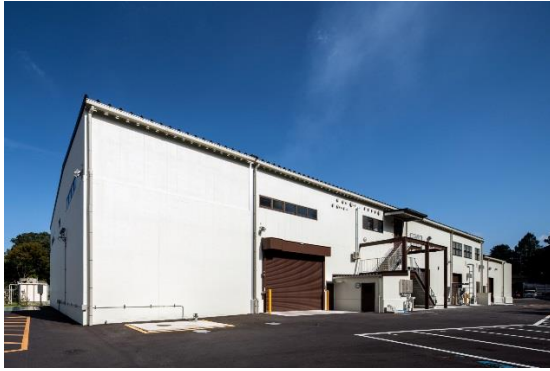
栗東 T・C バイオマス発電プラント（外観）