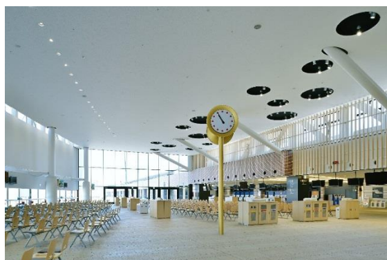
札幌競馬場「ファンファーレホール」

また、2014年夏にリニューアルオープンした札幌競馬場では、大きな側面ガラスから自然採光を行い、館内の自然照度を上げています。更に、天井照明はLED灯の採用により、消費電力の抑制を図っています。